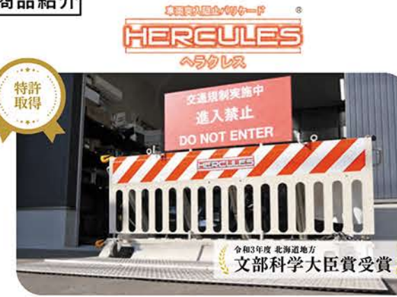
▲創業のきっかけにもなった主力製品「ヘラクレス」 移動型では国内初、アクセルを踏み続けても止めるバリケードです。

主力商品「ヘラクレス」は、テロ車両や暴走車両に対応する移動型のバリケード。時速80kmで加速・突進してくる車両を防御するだけでなく、停止させる機能を持たせたものは、移動型では国内初の技術。設置や撤去も簡単なので、イベントや高速道路の工事など、幅広く採用されています。他にも、駐車場の誤発進対策で開発した車止め「バリアーピット!」など世の中にあつたらいいと思うものを製品化しています。