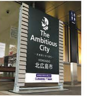
▲車止め「バリアーピット!」 簡易に設置できることに加えて、 広告としての利用も可能です。 (北広島市役所)